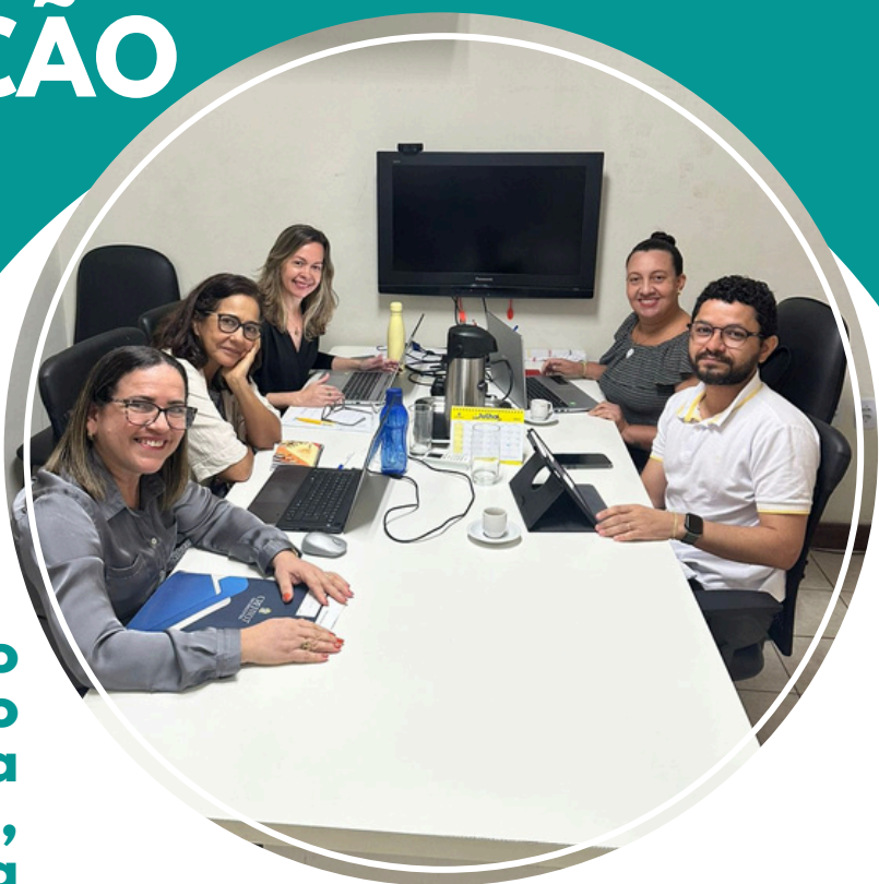
Comissão de comunicação

I PESQUISA DE CLIQUE AQUI COMUNICAÇÃO Contribua para o aprimoramento da nossa gestão